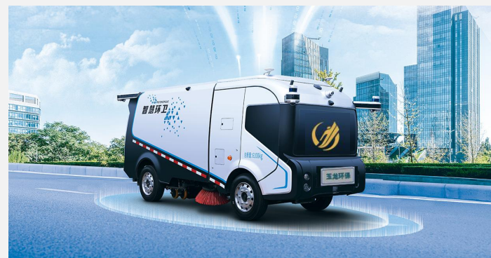
（新质生产力：AI+清洁服务机器人）